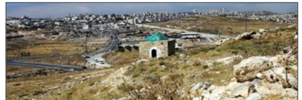
קבר השייח' עבד אל סלאם בשולי תל עלמית.

בשוליו של התל ישנה חלקת קבר עתיקה המיוחסת לשייח' עבד אל סלאם, הנחשב למייסד של הכפר ענתא, ולצדו קברים ערביים בני זמננו. גם כיום, משמש הקבר אתר תפילה ועלייה לרגל לתושבי הכפר.