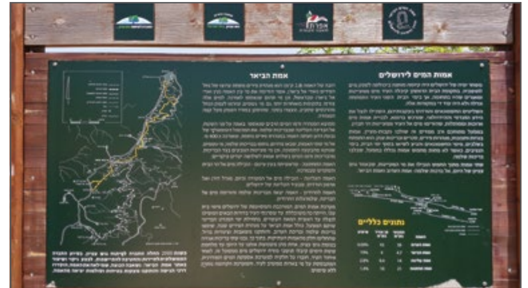
שלט הסברה בעברית בלבד בכניסה לאתר ההיסטורי אמת הביאר שבאדמות אל ח'אדר, המתאר את תולדות אמת המים והרשויות השותפות להפעלת האתר. צילום: יש דין, אפריל 2015.

באתרי העתיקות ברחבי הגדה המערבית נערכים אירועים מיוחדים לרגל חגי ישראל, ואף קונצרטים, מופעים עתיים ומגוון פעילויות פנאי המיועדים למבוגרים ולילדים ישראלים דוברי עברית. די להציץ בלוח האירועים שמציעה המועצה האזורית שומרון לרגל חג הסוכות באוקטובר 2017, הנחוג בסימן "יובל לשחרור השומרון". במסגרת החגיגות מוצעים סיורים ואירועי פנאי באתרים הארכיאולוגיים שבסבסטיה ובהר גריזים שבניהול רט"ג. 160