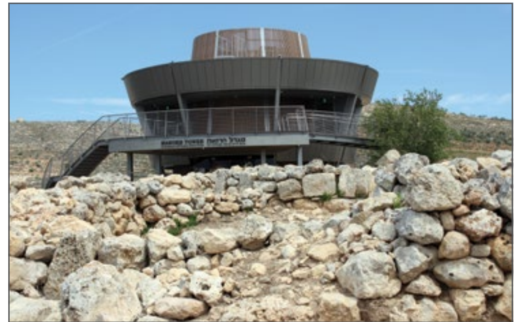
מגדל הרואה בתל שילה-ח'רבת סילון.

בקיץ 2013 הושלמו עבודות הפיתוח ובהן גולת הכותרת - מגדל התצפית בראש התל, שזכה לשם "מגדל הרואה" - מבנה דו-קומתי עגול, היצוק בבטון המתנשא לגובה 9 מ'. המגדל בנוי מקורות ברזל, אך יסודות הבטון הגדולים שלו חדרו אל לב התל, וייתכן שפגעו בממצאים שמתחתיו ובסביבותיו. 204 במגדל ישנם מרפסת תצפית, מיצג המוקרן על גבי קירות זכוכית במערכת מולטימדיה ומוזיאון "דברי ימי שילה". 205 ב-23.7.2014 נערכה חנוכת "מגדל הרואה" בהשתתפות אישי ציבור רבים, ובהם שרים בממשלת ישראל. 206