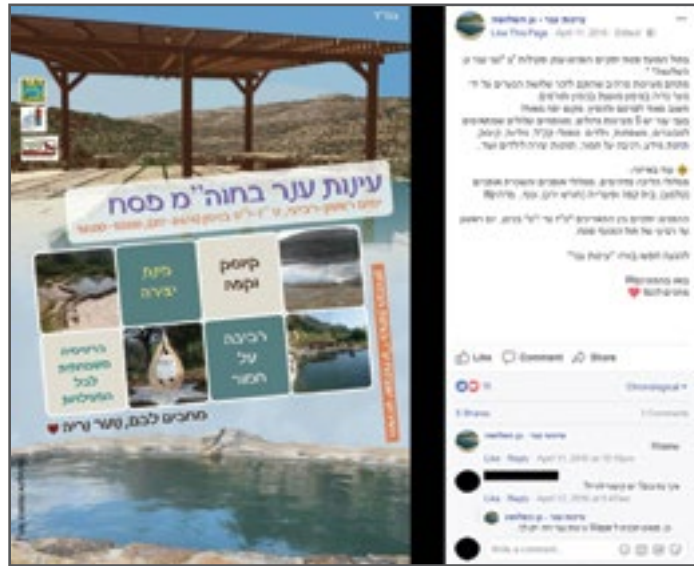
פרסומים בעמוד הפייסבוק של "עיינות ענר-גן השלושה", אפריל 2016.

בעלי האדמות, המודאגים מאוד מפלישת המתנחלים ומהפיכת המקום לאתר תיירות, הגישו תלונה למשטרה בגין הסגת גבול באפריל 2016, אך תיק החקירה נסגר. 105 בנוסף, במאי 2016 פנו בעלי האדמות למינהל האזרחי בבקשה כי יטפל בבנייה הבלתי חוקית שנעשת באדמותיהם, אך פעולות אכיפה להסרת הבנייה הבלתי חוקית לא בוצעו.