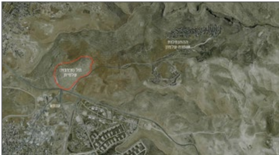
תל (ח'רבת) עלמית, הכפר ענתא וההתנחלות ענתות-עלמון

בשטח השיפוט נכללו גם אדמותיהם הפרטיות של חלק מתושבי הכפר ענתא. למעשה, משום שתל (ח'רבת) עלמית מוקף באדמות פלסטיניות פרטיות, לא ניתן היה לכלול את התל הארכיאולוגי בתחום השיפוט של ההתנחלות כך שיווצר רצף גיאוגרפי בין השניים, מבלי לכלוא בתוכו אדמות פרטיות של תושבי הכפר.